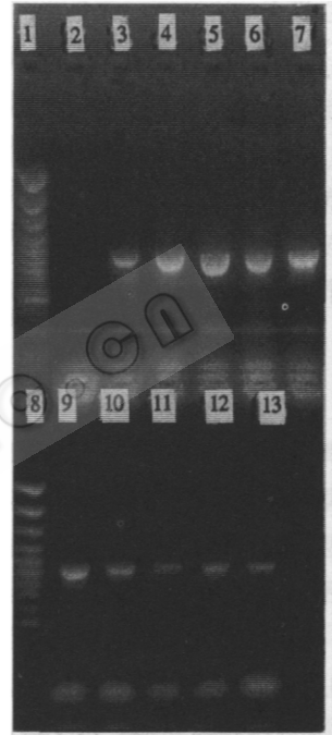
图3 基因组的 YMC1 基因的 PCR 扩增时程实验

1 100bp 梯级分子量标准 (3.0kb, 2.0, 1.5, 1.2, 1.1, 1.0, 0.9, 0.8), 2 无模板的负对照, 扩增 arg-13 基因, 3 模板为从大肠杆菌提取的质粒 pYXA5, 扩增 arg-13 基因, 4 模板为从酵母提取的质粒 pYXA5, 扩增 arg-13 基因, 5 从转化子用煮沸法制备的质粒与基因组 DNA 模板, 扩增 arg-13 基因, 6 无模板的负对照, 扩增基因组的 YMC1 基因, 7 从转化子用煮沸法制备的质粒与基因组 DNA 模板, 扩增基因组的 YMC1 基因, 8 煮沸法制备的基因组 DNA(酿酒酵母菌株 1c1636d arg 11, ura -3)模板, 扩增基因组的 YMC1 基因