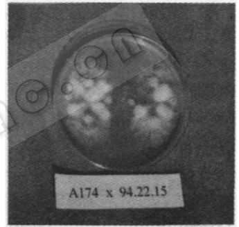
图 1 同核体菌株间配对杂交反应

在本研究中，评价两亲本是否亲合，杂交是否成功的唯一指标是 RAPD 标记指标。因为 RAPD 标记是 DNA 水平上的指标，杂交是否成功就是看两亲本的 DNA 是否组合到后代的细胞中，所以 RAPD 指标比形态指标（白色绒毛状异样菌丝），细胞学指标和拮抗试验的指标更准确可靠。在 93.9.11 X AA0373.15 的 RAPD 指纹都只出现单一亲本（AA0373.15）的指标，未发现任何双亲组合的痕迹。结合拮抗试验和细胞学观察结果，可以断定 93.9.11 X AA0373.15 并不是 93.9.11 和