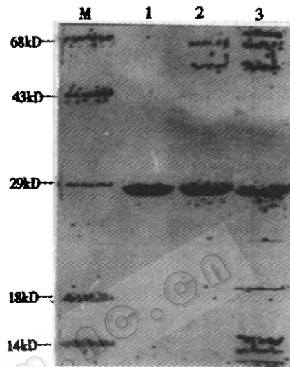
图3 提纯病毒 SDS-聚丙烯酰胺凝胶电泳结果

M 蛋白质 markers, 1 方法(2)提纯病毒, 2 方法(3)提纯病毒, 3 方法(1)提纯病毒