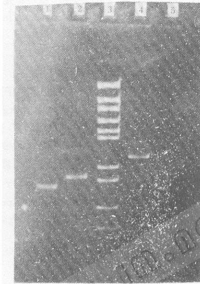
图 3 PCR 产物的琼脂糖电泳

FC 2 、FC 3 和 FCS 均可由相应的片段通过 PCR 方法合成, 不过因连接片段的用量不同, 作为模板的量也随之不同; FC 1 时为 0.15pmol, FC 2 时为 0.81pmol, FC 3 时为 1.5pmol, FCS 时为 0.13pmol。所有的 PCR 扩增产物走琼脂糖凝胶电泳均可见到清楚的条带 (图 3)。