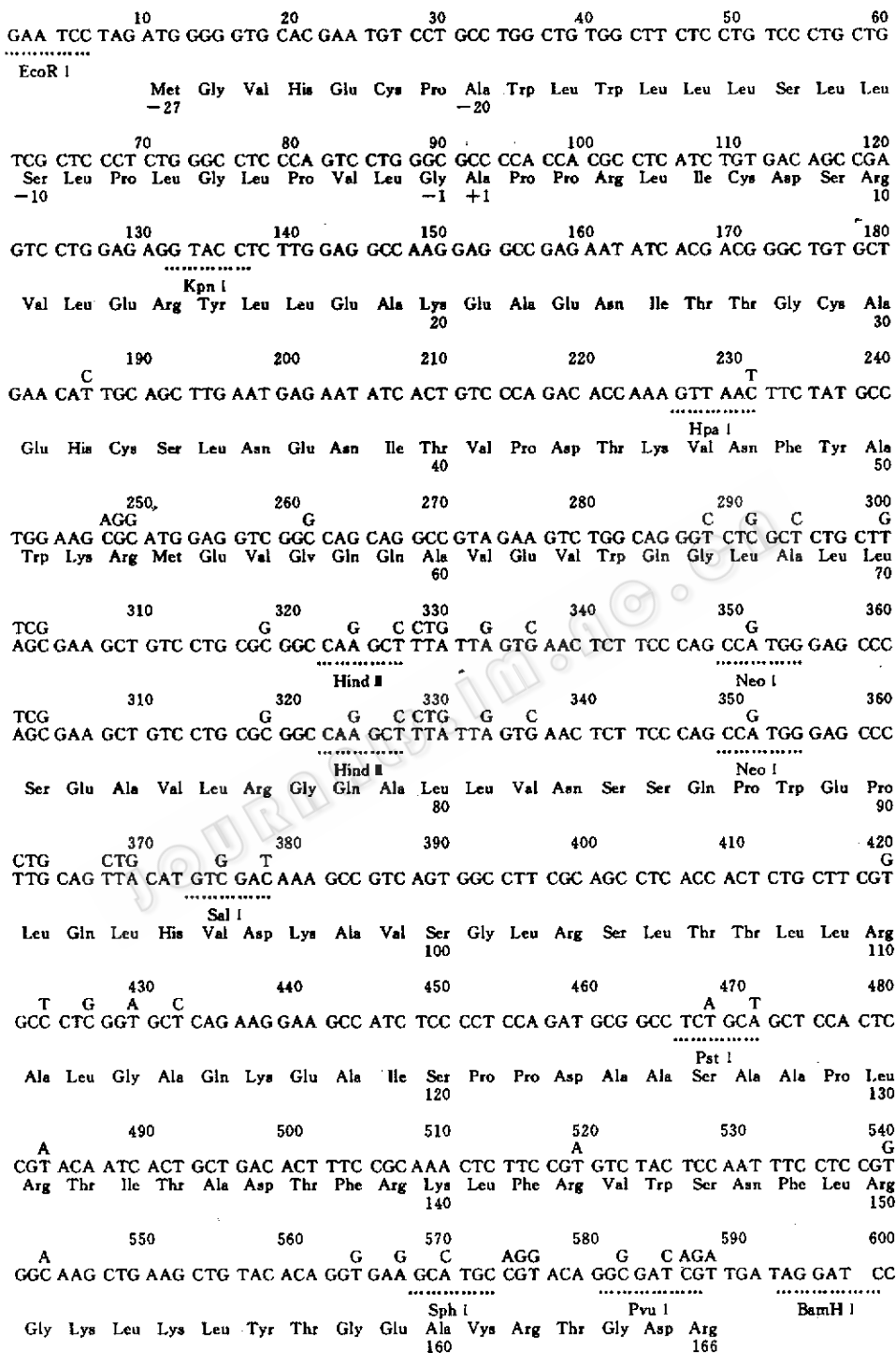
图 1 合成 hEPO 基因的顺序 合成序列上的核苷酸为天然顺序