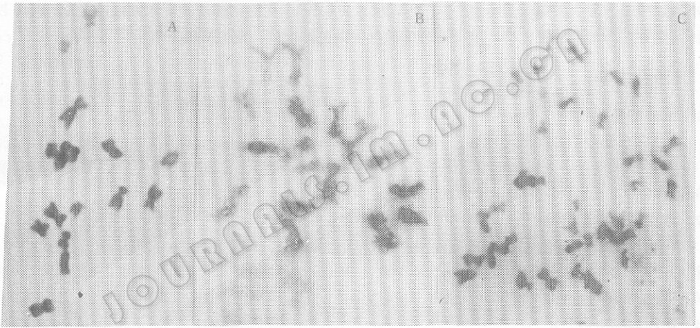
图 1 甘蓝×菜心 F 1 (2n=19, A)、花培 1 号 (n=17, B) 和花培 2 号 (2n=34, C) 根尖细胞染色体

花粉植株 1992 年 6 月盆栽于网室, 均在同年 11 月上旬开花, 根尖细胞染色体数分别为 17 (花培 1 号) 和 34 (花培 2 号), 见图 1。