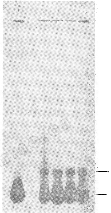
图 2 NAR对NODD和nod-promoter 专一性结合的影响

Fig.1 The effect of NAR on NODD-nod-promoter specific binding Top arrow indicated NODD-nod-promoter binding band Low arrow indicated native fragment