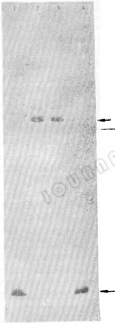
图 1 NAR对NODD和nod-promoter 专一性结合的影响

图 2, 在1—4管的单独反应中, 含有相同量的487DNA(含100倍于标记DNA量的pBR322DNA作竞争DNA), 2—4管中纯化NODD量为1 \mu l, 3号管加1 \mu l的乙醇, 4号反应加1 \mu l40mmol/L NAR(溶于乙醇), 反应体积各管均为10 \mu l, 室温反应15min, 加样在10%非变性聚丙烯酰胺凝