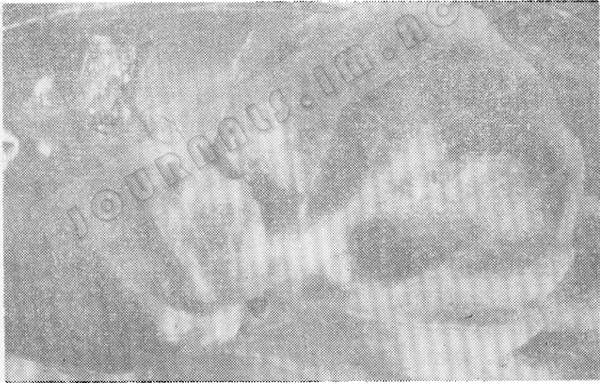
图 2 转化根在含有 14\mu\text{mol/L} 激动素的MS琼脂培养上分化幼茎

Number of young shoots per treatment is the sum of young shoots from 40 root cultures in the Table